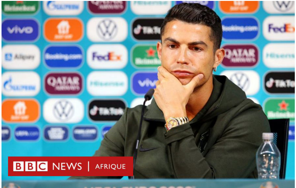
Fig. 58 : Une bouteille d'eau en plastique visible lors d'une interview d'un joueur de foot

Lorsque leur suppression complète n'est pas possible, il est essentiel de veiller à ne pas valoriser ou banaliser ces pratiques. Les produits ou comportements à fort impact environnemental devraient être associés à une perception négative, sur le modèle de la sanction sociale appliquée aux comportements contraires aux règles sportives ou à l'éthique du jeu, afin de renforcer la sensibilisation et de promouvoir des alternatives plus durables.